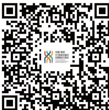
文化科技融交会媒体登记二维码

2021 中国（南京）文化和融合成果展览交易会公开媒体报名渠道，媒体记者通过扫描以下二维码或点击“媒体报名入口”登记基本信息，在展会现场领取媒体证件入场：