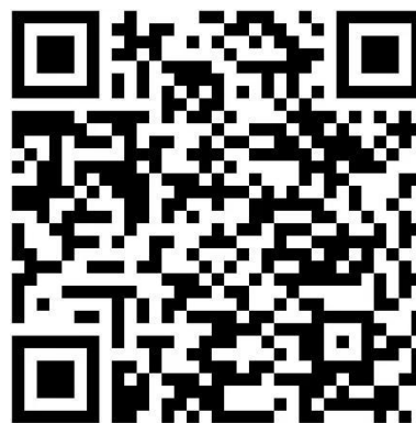
2021 文化科技融交会官方云相册